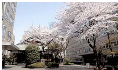
▲ 世田谷キャンパス

本学本部のある世田谷は、周辺に幕末の志士吉田松陰をまつる松陰神社、徳川幕府の大老井伊直弼が眠る豪徳寺があり、歴史の息吹が身近に感じられる環境にあります。また、区役所、税務署、保健所などが集中する世田谷区政の中心地でもあります。